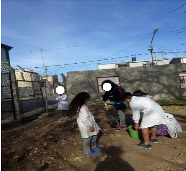
Proyecto huerta escolar.