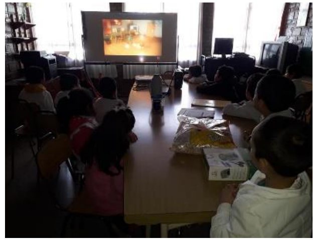
Sala de proyección/computación