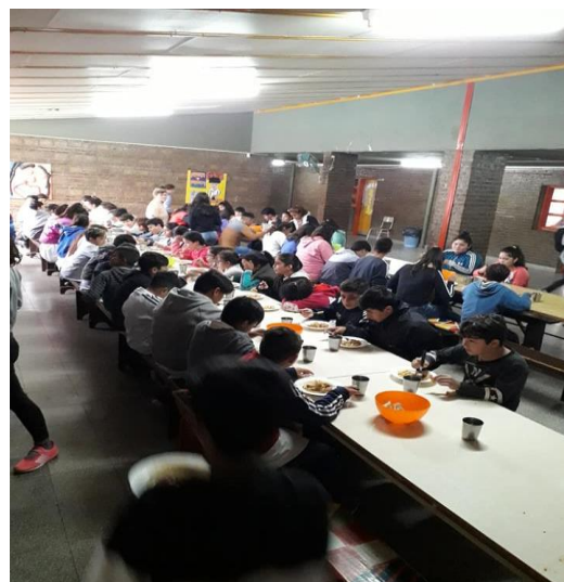
Cocina y comedor escolar.

La escuela de nivel inicial y primario pertenecientes a la escuela Perón , poseen una matrícula de 142 estudiantes mientras que el nivel secundario -escuela Ghandi - cuenta con 326 estudiantes. Los motivos en el número desigual de la matrícula de estudiantes que asisten a los diferentes niveles, según los directivos de las escuelas mencionaron, es que el barrio “fue envejeciendo”. Es decir, cada vez son menos las familias con niños y niñas en edad escolar. En otras palabras, cuando la escuela primaria se creó, el barrio era habitado por muchos niños y niñas que al transformarse en adultos emigraron hacia otros barrios y la población que fue quedando es mayormente adulta.