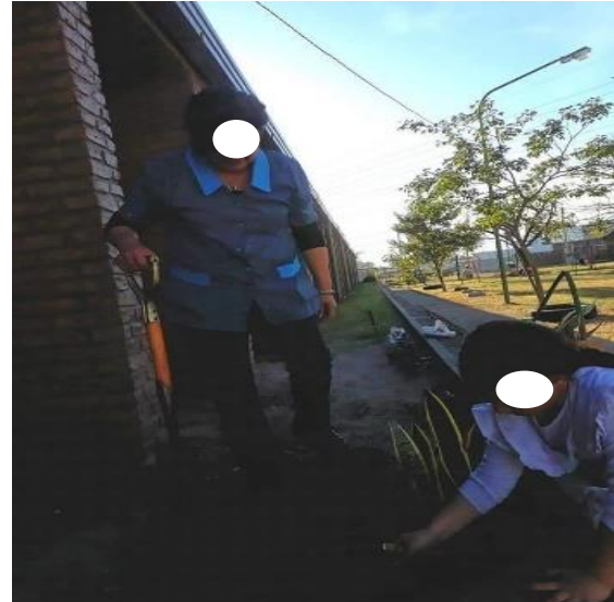
Proyecto plantando colores.

Como toda institución está a cargo de una directora que se ocupa de las tareas administrativas y también de las pedagógicas. A fin de colaborar con los trámites educativos, hay una secretaria cuyos aportes son fundamentales para la directora, porque a pesar de tener pocos alumnos y alumnas, el hecho de contar con un comedor escolar y copa de leche, significa un mayor esfuerzo organizativo y de logística.