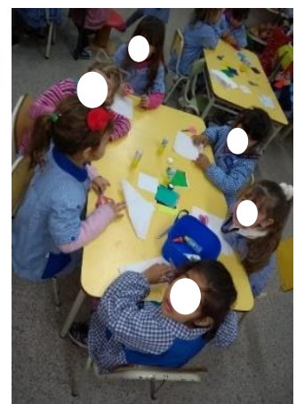
Salita inicial

Para completar la descripción de los espacios con los que cuenta este establecimiento educativo destacamos la importancia del parquecito de juegos que tiene en el lateral izquierdo del edificio. Allí, en el año 2018, se instalaron juegos infantiles que se recibieron como donaciones de personas particulares de la ciudad. Este espacio recreativo cuenta con una variada arboleda y con espacios disponibles donde, diferentes