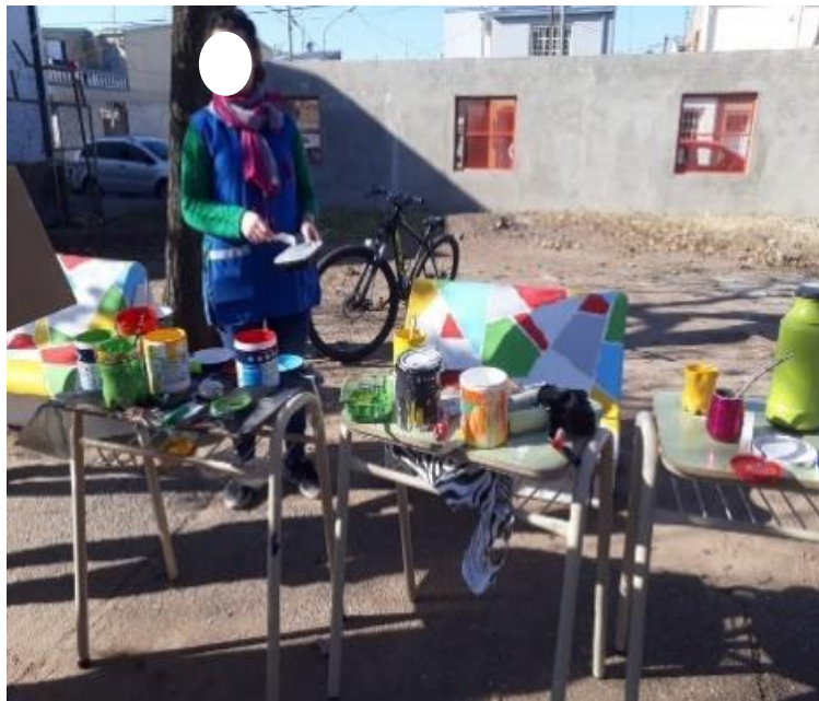
Clase de plástica al aire libre.