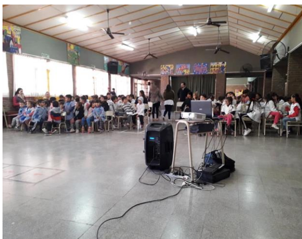
Patio interno/Salón de actos

Espacialmente, la escuela cuenta con un espacio amplio, luminoso y cálido. El salón interno se utiliza como patio para los recreos y también es el espacio para los actos escolares. Este salón tiene grandes ventanales hacia el patio exterior del establecimiento como se puede observar en las imágenes.