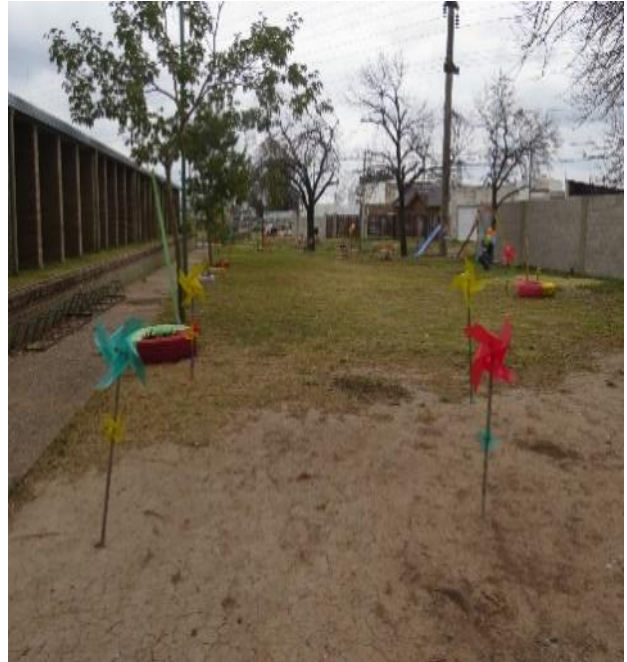
Parque de juegos.