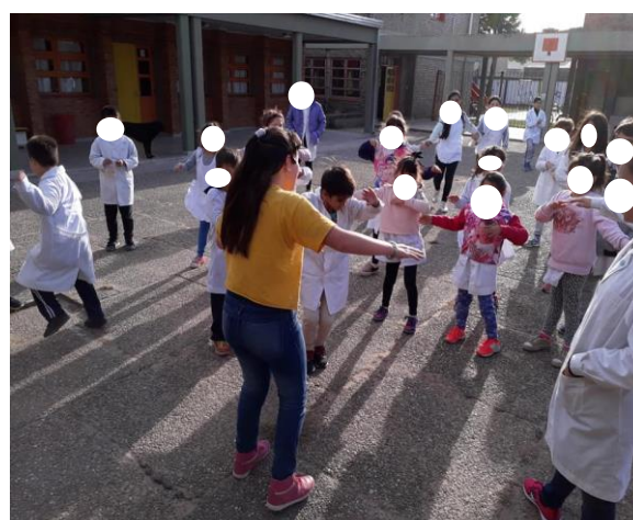
Patio exterior de la escuela