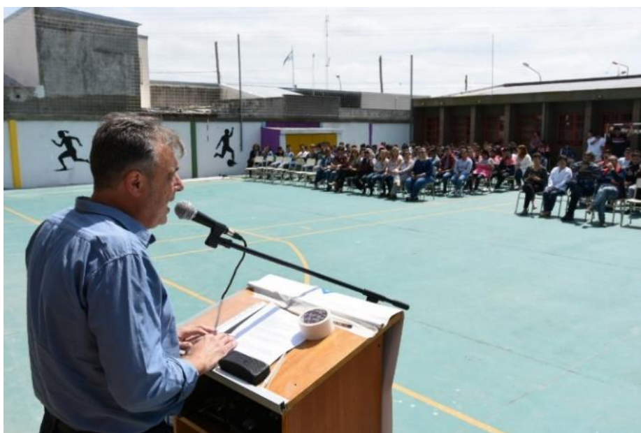
Acto de inauguración del playón deportivo con el Intendente.

En el año 2018, gracias al aporte de la Municipalidad de Rafaela -y al diálogo que la institución sostuvo con el senador departamental Alcides Calvo- se inauguró el playón polideportivo dentro de la institución donde se llevan a cabo las diferentes actividades recreativas y de Educación Física.