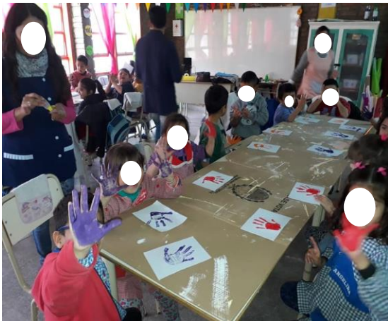
Taller de tecnología.