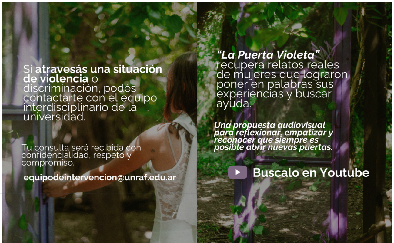
Imágenes 8 y 9. Propuesta de carrusel informativo para Instagram de UNRaf, presentando el Protocolo de Actuación ante Situaciones de Violencia y Discriminación y el cortometraje “La Puerta Violeta”.

Otro espacio que podría ocupar este material es dentro de los espacios de formación de la Ley Micaela. El objetivo es que sirva para acompañar las capacitaciones y abrir la reflexión sobre la violencia de género desde una mirada audiovisual, con testimonios reales y una forma más cercana de abordar el tema. Este recurso sería de gran utilidad ya que además de abordar la existencia del protocolo, explica cuáles son los tipos de violencia hacia la mujer que existen.