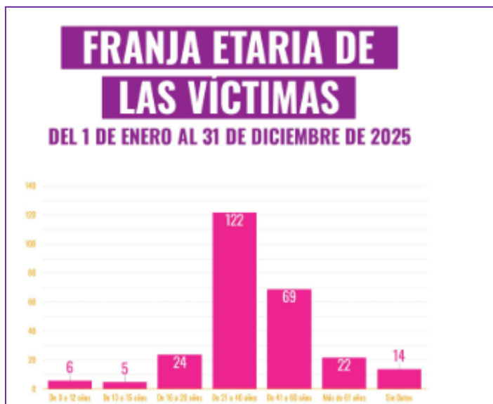
Imagen 6.

La decisión de orientar este proyecto a la comunidad universitaria no responde únicamente al objetivo de difundir el protocolo, sino también a los datos que muestran que una parte significativa de las mujeres que atraviesan situaciones de violencia se encuentran en un rango etario compatible con la etapa de formación universitaria. En muchos casos, se trata de jóvenes que se encuentran estudiando una carrera. Por este motivo, considero fundamental trabajar desde este espacio, fortaleciendo la prevención, la sensibilización y el acompañamiento institucional.