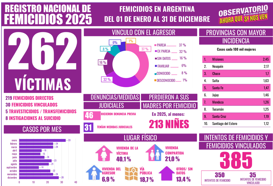
Imagen 1. Infografía sobre femicidios en Argentina 2025.

Por otra parte, en relación con los femicidios, el Observatorio “Ahora Que Sí Nos Ven” reporta que, entre el 1° de enero y el 31 de diciembre de 2025, se registraron 262 femicidios en Argentina. En este mismo período se contabilizaron 385 intentos de femicidio, y solo el 18 % de las víctimas había realizado una denuncia previa, lo que refuerza la urgencia de políticas preventivas y redes de acompañamiento (Observatorio Ahora Que Sí Nos Ven, 2025).