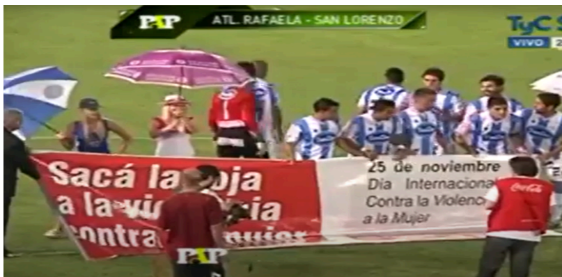
Imagen 3. Jugadores y personal de Atlético de Rafaela y San Lorenzo sosteniendo un banner en apoyo al Día Internacional de la Eliminación de la Violencia contra la Mujer, durante el partido por el Torneo Inicial 2013, Fecha 17. Captura de video.