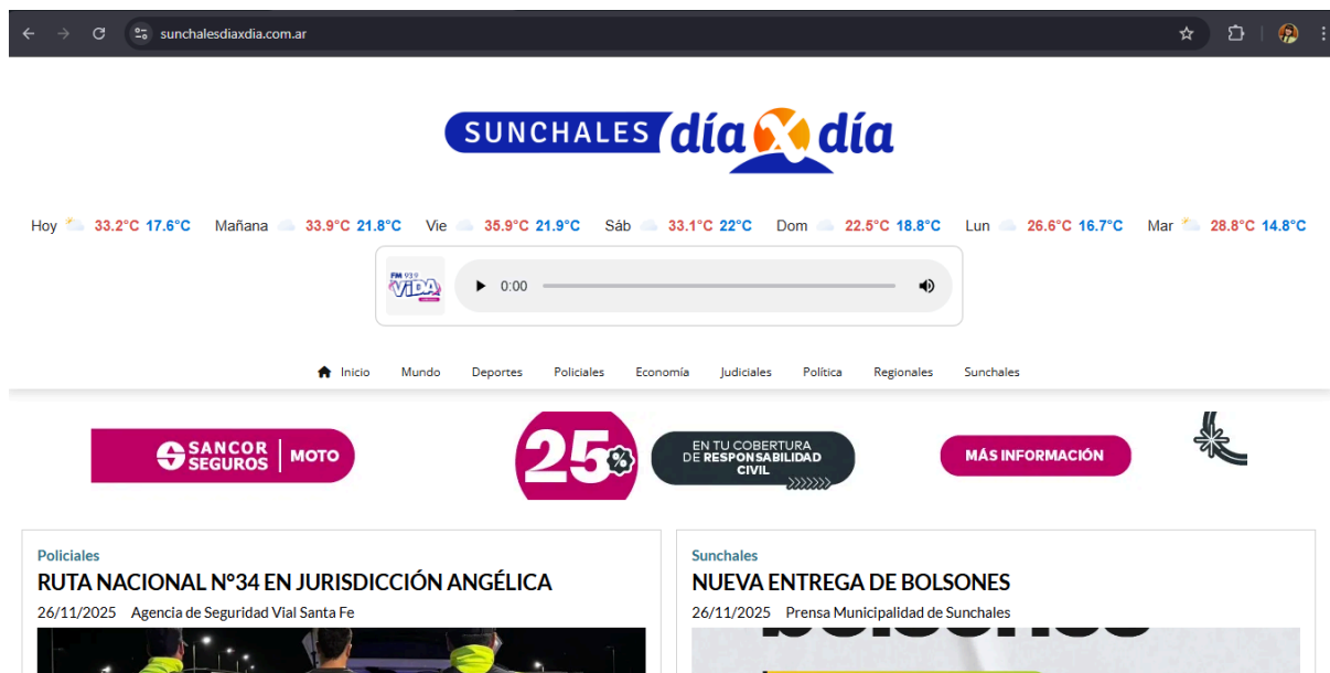
Página web Sunchales Día por Día

fotos y videos de situaciones que suceden en la ciudad o alrededores).