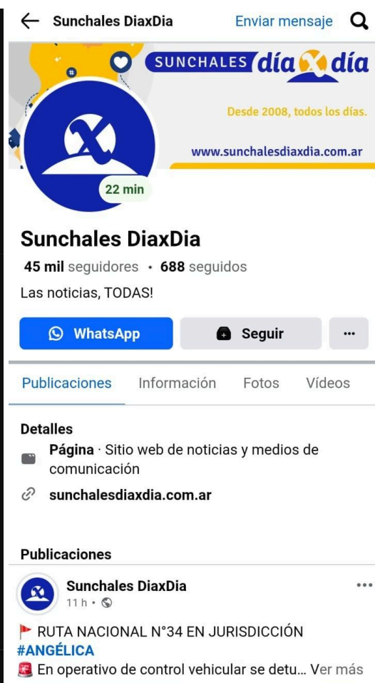
Canal en YouTube-Sunchales Día por Día