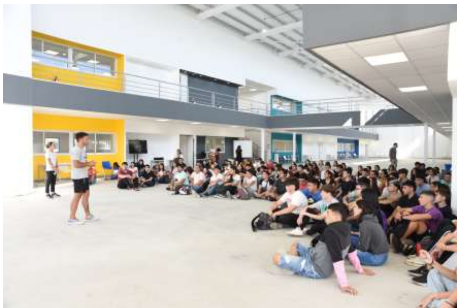
Figura 5 : Bienvenida a ingresantes en el hall del Edificio 4 del campus

Algunas palabras que se repiten en el análisis de testimonios de ingresantes refieren a cercanía, espacio familiar, apoyo, guía, sueños, futuro, expectativa. 12