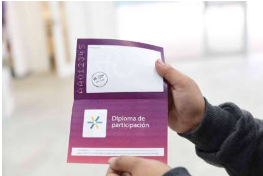
Figura 6 : Foto del pasaporte entregado a estudiantes.

es planteada como “tomar parte” de algo. El pasaporte habilitaba la participación y al mismo tiempo, la certificaba, es decir, le otorgaba reconocimiento. Esta característica se trabajó utilizando el sello de la universidad, como símbolo de pertenencia.