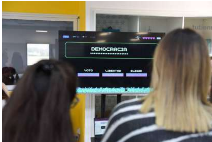
Figura 11: Tabú de la democracia.

Trabajo preparado para su presentación en el XVI Congreso Nacional y IX Internacional sobre Democracia, organizado por la Facultad de Ciencia Política y Relaciones Internacionales de la Universidad Nacional de Rosario. Rosario, 04 de noviembre al 07 de noviembre de 2024.