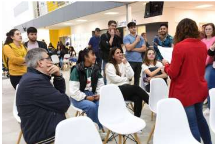
Figura 13: docentes y estudiantes respondiendo preguntas del juego 3 escalones hacia la democracia.

Trabajo preparado para su presentación en el XVI Congreso Nacional y IX Internacional sobre Democracia, organizado por la Facultad de Ciencia Política y Relaciones Internacionales de la Universidad Nacional de Rosario. Rosario, 04 de noviembre al 07 de noviembre de 2024.