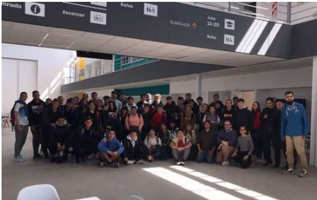
Figura 2: Estudiantes de Entrenamiento Deportivo en la Charla "40 años de deporte en democracia. Una historia pendular contada a través de los Juegos Olímpicos".

Trabajo preparado para su presentación en el XVI Congreso Nacional y IX Internacional sobre Democracia, organizado por la Facultad de Ciencia Política y Relaciones Internacionales de la Universidad Nacional de Rosario. Rosario, 04 de noviembre al 07 de noviembre de 2024.