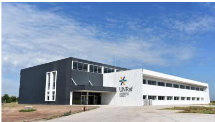
Figura 3: Edificio de aulas en el campus universitario

Se trata de una situación que consideramos imprime características específicas en cuanto a la apropiación del espacio y el sentido de pertenencia de los estudiantes, dado que contar con un espacio específico refuerza su identidad.