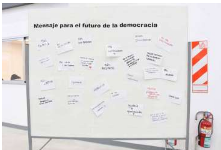
Figura 15: mensaje para el futuro de la democracia elaborado por participantes del evento.

Trabajo preparado para su presentación en el XVI Congreso Nacional y IX Internacional sobre Democracia, organizado por la Facultad de Ciencia Política y Relaciones Internacionales de la Universidad Nacional de Rosario. Rosario, 04 de noviembre al 07 de noviembre de 2024.