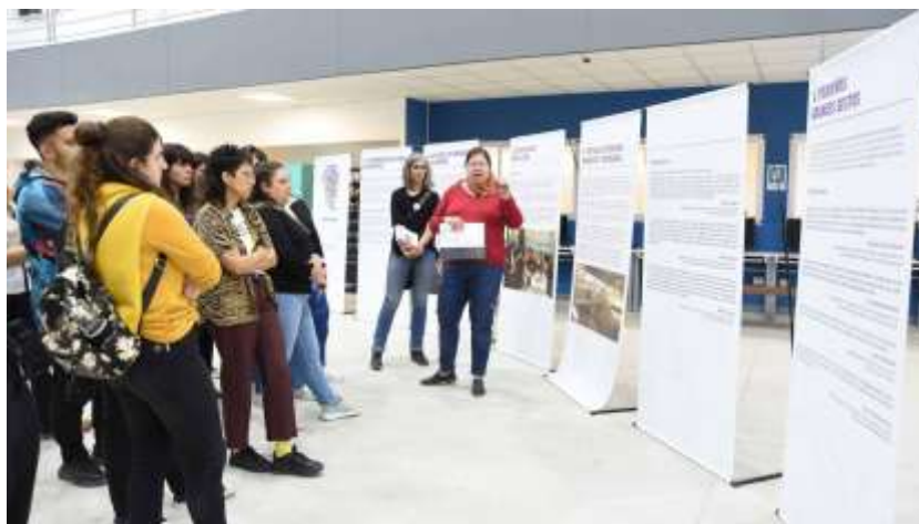
Figura 10: Estudiantes-guías realizando la visita

En este espacio era posible realizar una visita guiada por la muestra “Ser mujeres en la ESMA”. La propuesta, cuyo origen fue impulsada a través de un proyecto de extensión con la comunidad, buscaba profundizar la mirada sobre las consecuencias en la vida de las sobrevivientes después de salir del centro clandestino. Estaba basada en los testimonios judiciales de las sobrevivientes sobre la violencia de género y diversos delitos sexuales cometidos por el Grupo de Tareas de la Escuela de Mecánica de la Armada (ESMA). Un grupo de estudiantes de la universidad realizaba el recorrido guiado. De esta manera, se habilitaba la voz de sus compañeros y compañeras como relatores de una experiencia.