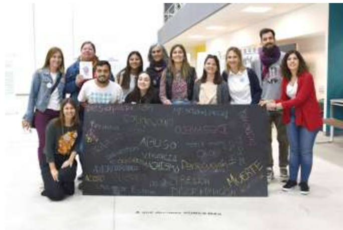
Figura 14: registros de “A qué decimos Nunca más”

Por último, se facilitaron dos espacios de intervención mediante la escritura: por un lado, una pizarra en donde los/as participantes plasmaron sus deseos frente a la consigna “A qué nunca más”. El segundo, en donde se dejaron registros de sus proyecciones para el futuro de la democracia.