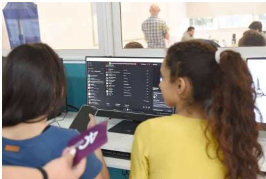
Figura 9: alumnas explorando las listas de Spotify vinculadas a los 40 años de democracia.

Buscando la integración de distintos sentidos, se desarrolló una estación auditiva. Mediante listas de Spotify, se pusieron a disposición espacios de escucha de testimonios vinculados a la época de la última dictadura cívico-militar en nuestro país. Asimismo, se socializaron fragmentos de la historia narrados por historiadores/as argentinos/as referentes en el tema. Por último, se consolidaron artistas musicales icónicos de la época, cuyas canciones apuntaban a la difícil etapa que se vivía en la Argentina.