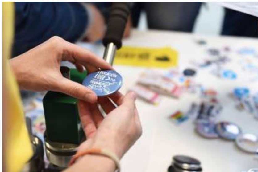
Figuras 7 y 8: artículos estampados por estudiantes.

Trabajo preparado para su presentación en el XVI Congreso Nacional y IX Internacional sobre Democracia, organizado por la Facultad de Ciencia Política y Relaciones Internacionales de la Universidad Nacional de Rosario. Rosario, 04 de noviembre al 07 de noviembre de 2024.