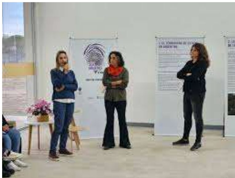
Figura 1.: Apertura de la muestra en el hall del edificio 4 del Campus de UNRaf -

Tal como lo reflejan estas actividades, se trató de una agenda con una diversidad de propuestas que buscaron la reflexión acerca del valor de la democracia a través de distintos formatos. Una cuestión a destacar estuvo vinculada a la apertura de la universidad, que abrió sus puertas no sólo a estudiantes, docentes y personal que allí se desempeña, sino también a ciudadanos que por primera vez visitaron la casa de estudios.