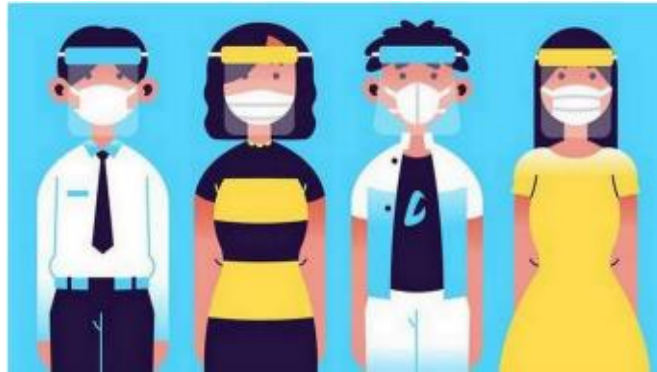
Figura 1: Uso de máscara y barbijo para docentes

Nota. Instituto Nacional de Formación Docente, 2021. 19