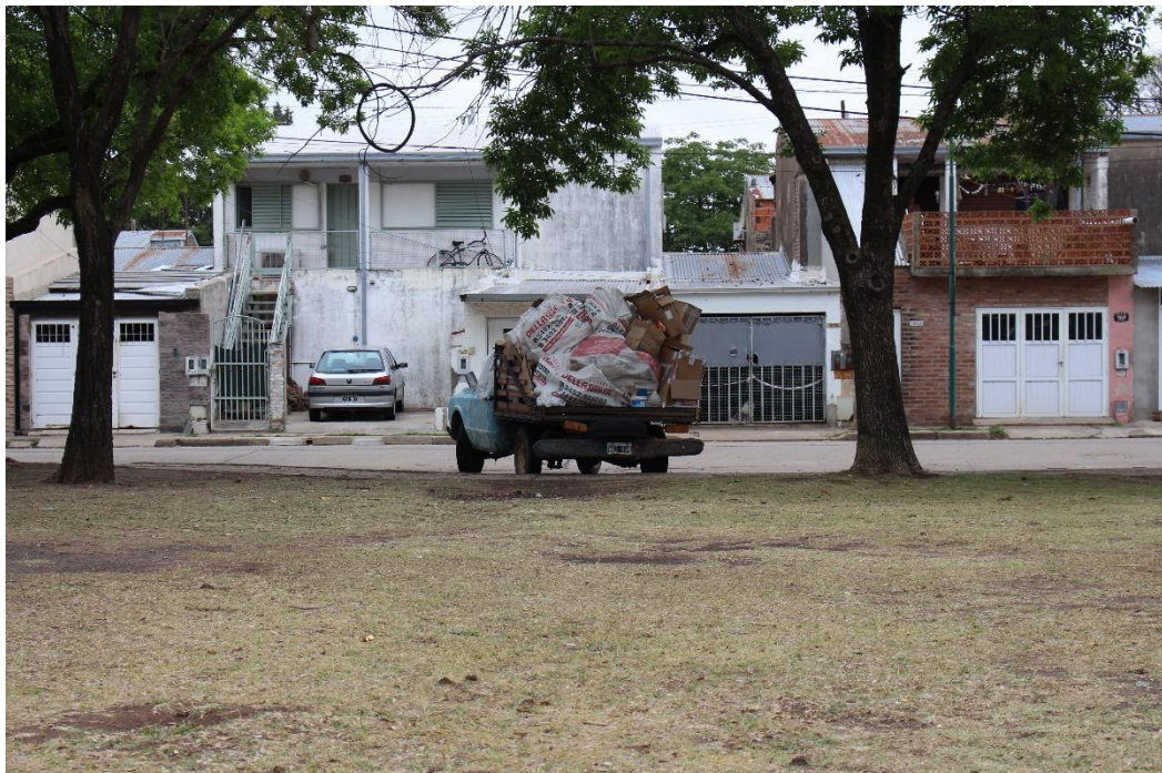
IMAGEN VI El oficio de chacaritero. 2022