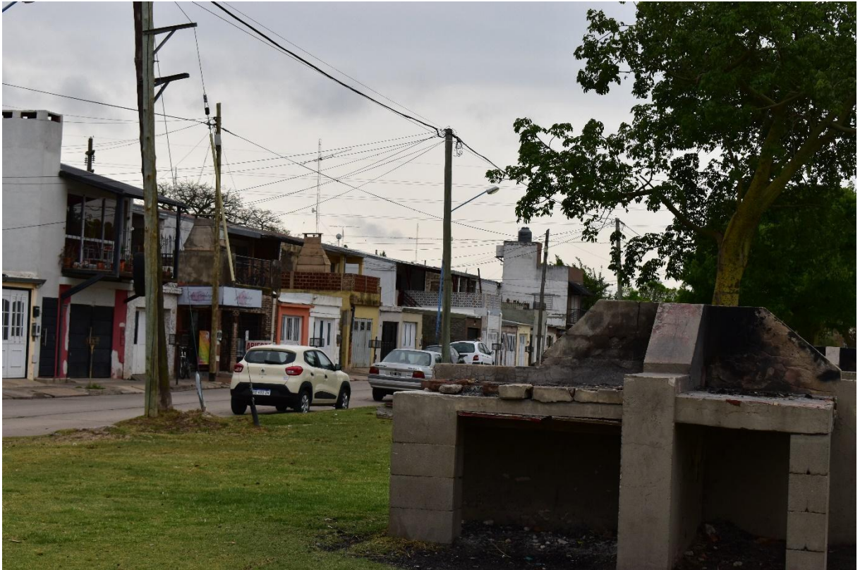
IMAGEN IX Asadores. 2022