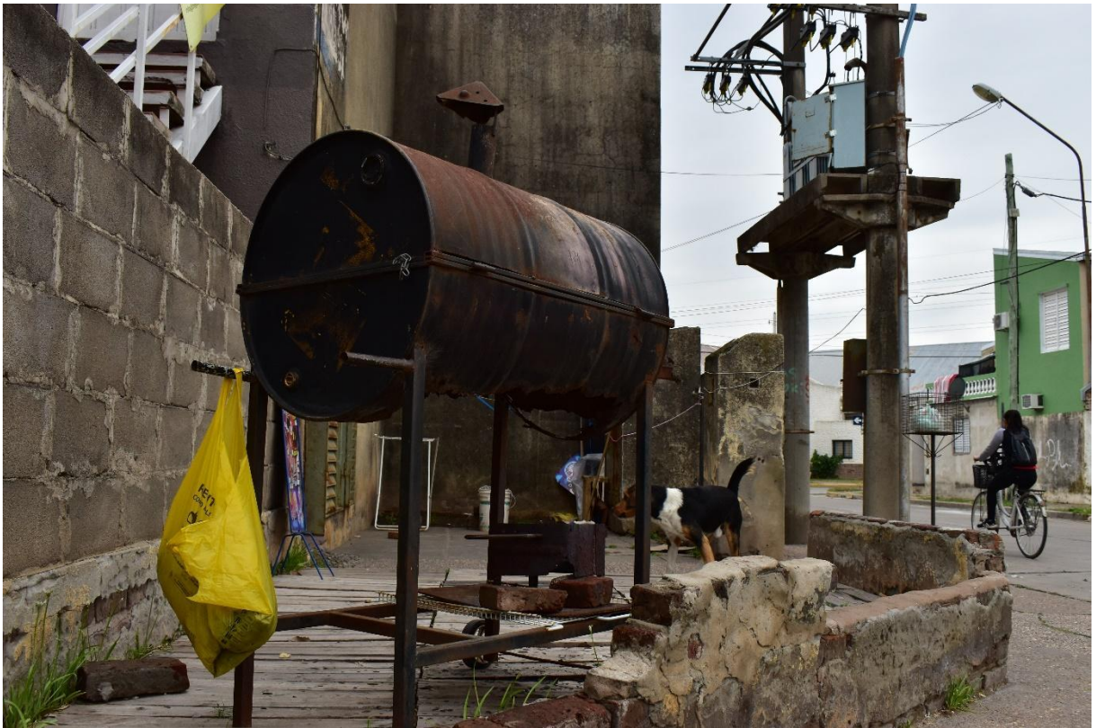
IMAGEN VIII Asadores. 2022