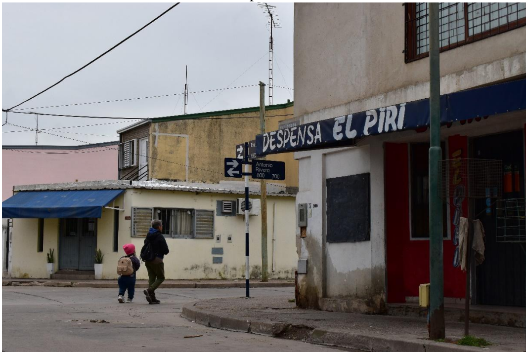
IMAGEN IV La despensa. 2022