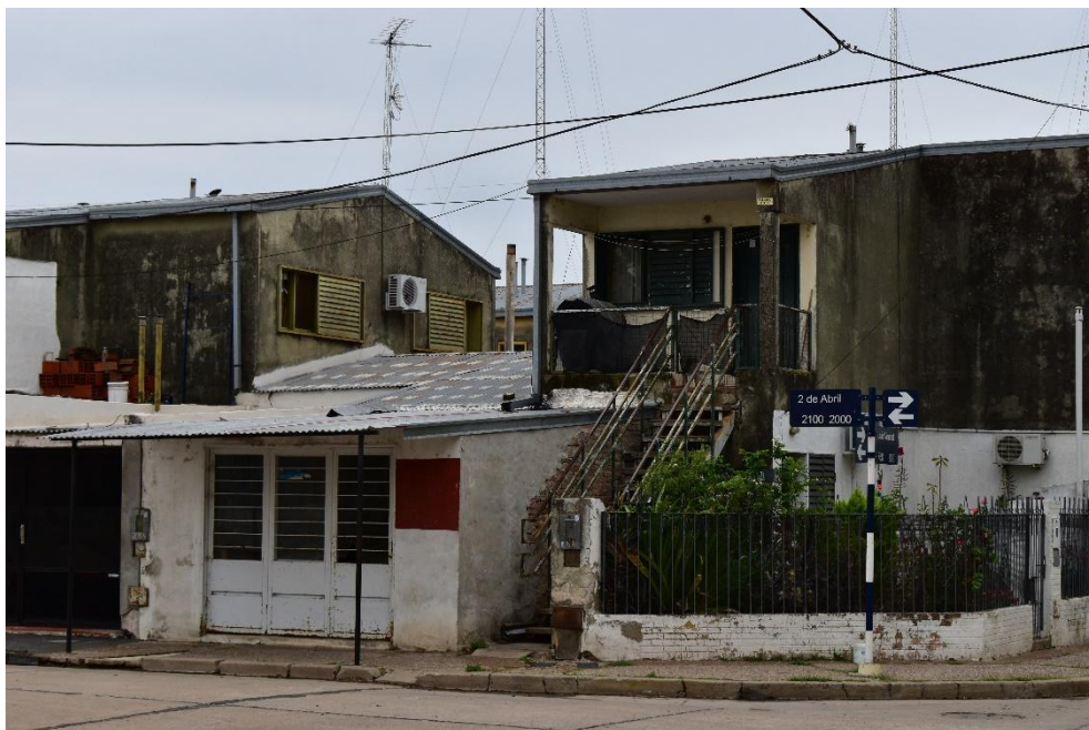
IMAGEN III Las casas del 17. 2022