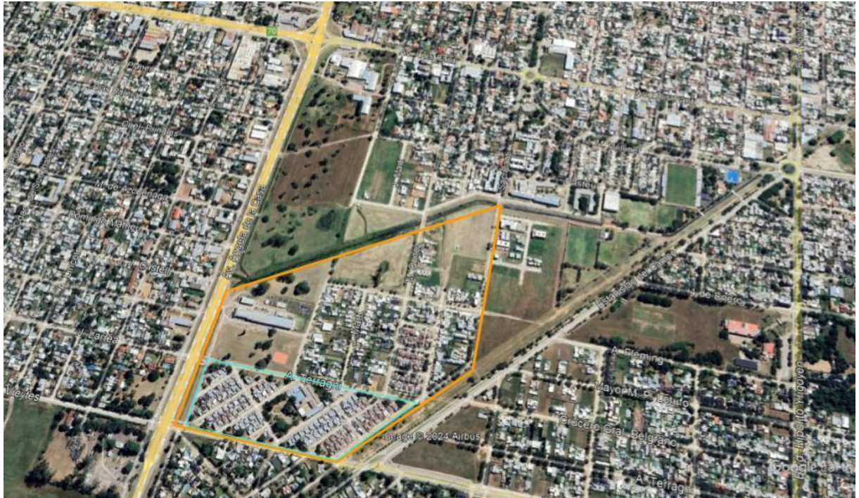
IMAGEN I Barrio 17 octubre. 2024