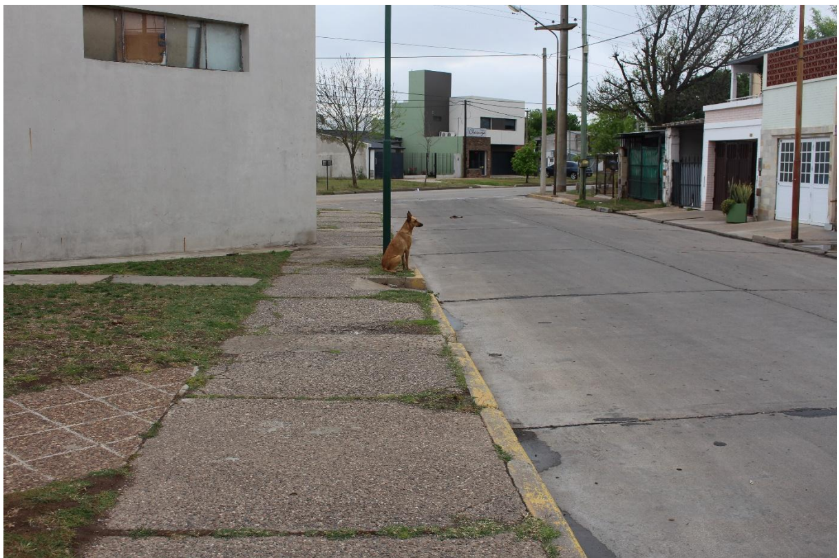
Perro en la vereda. 2022