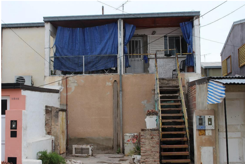
IMAGEN II Las casas del 17. 2022