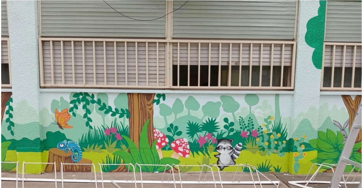
Imagen 3. Título: "Bosque encantador" (2024). Ubicación: Esc. N° 475, B. Rivadavia (3 de Febrero y Bv. Roca) - Barrio 9 de Julio. Medidas aproximadas: 1,50 x 40 metros.

La intervención surge de un pedido de la Escuela N°475, con el objetivo de embellecer el frente del establecimiento y generar un espacio de apropiación simbólica para la comunidad educativa. El diseño fue concebido directamente por infancias que asisten a la institución, con acompañamiento de la docente de plástica, quien digitalizó los dibujos originales para elaborar un boceto final.