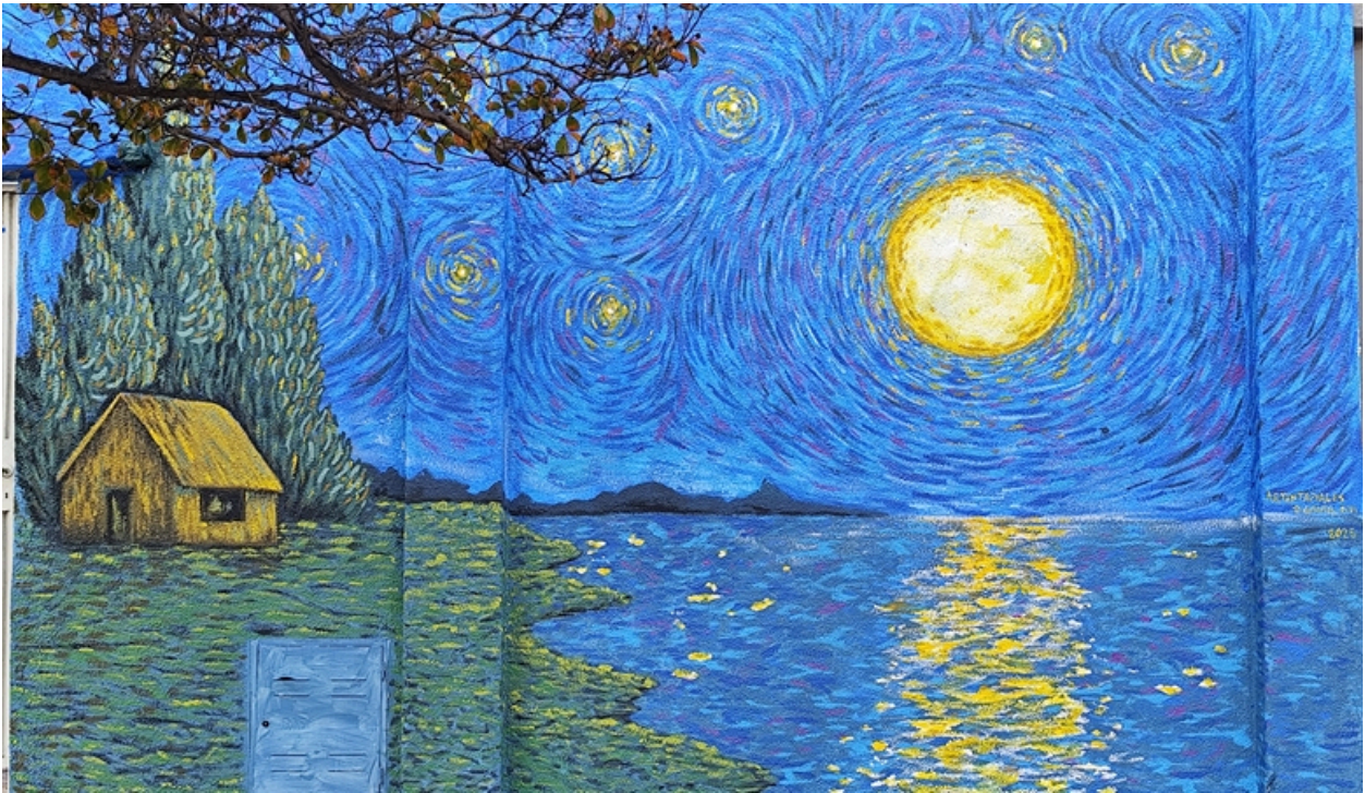
Imagen 4. Mural: Tonada de luna llena (2025). Lugar: Ayacucho 96 - Barrio 9 de julio.