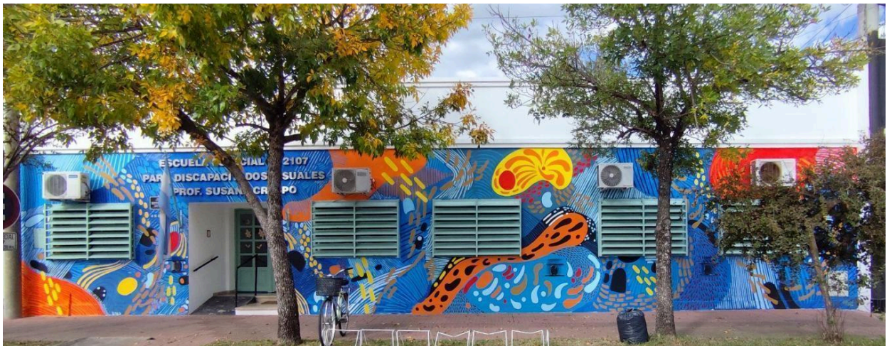
Imagen 5. Título: Sinfonía de colores (2025). Ubicación: Rosario 450 - Barrio 9 de Julio. Medidas Aproximadas: 15 x 3 metros.

La intervención surge a partir de un pedido de la profesora Susana Crespo para la Escuela Especial N° 2107, con el objetivo de visibilizar su presencia en el barrio y generar un impacto positivo en quienes asisten a la institución. La propuesta buscaba resaltar la fachada de la escuela mediante colores y figuras llamativas, contribuyendo a la identidad del espacio y al sentido de pertenencia de la comunidad educativa.